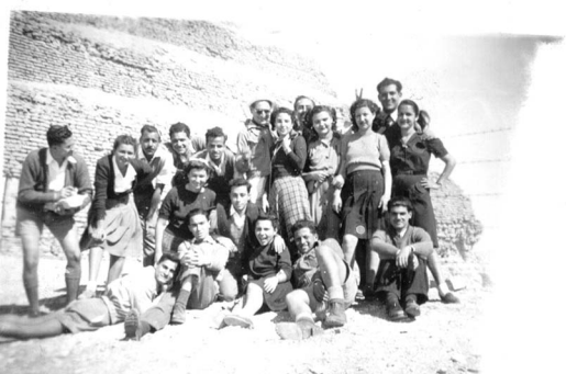
HISTORICAL SOCIETY OF JEWS FROM EGYPT