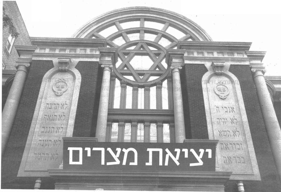
על שולחן הסדר ביום שני תחוגג קהילה אחת בברוקלין יציאת כפולה ממצרים, פעם אחת בימי פרעה ופעם שניה בימי נאצר